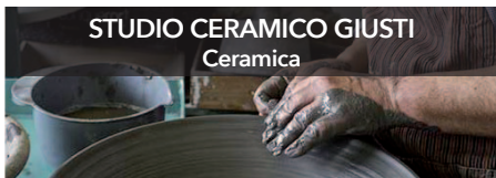
STUDIO CERAMICO GIUSTI Ceramica