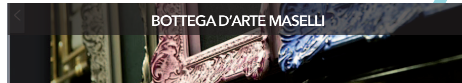
BOTTEGA D'ARTE MASELLI

L'attività, nata nel 1955 come bottega d'arte, si inserisce nell'antica tradizione fiorentina dell'artigianato artistico vantando una clientela privata nazionale e internazionale. Oggi il negozio è una piccola bottega artigianale che, grazie all'esperienza, alla passione e alla cura dei particolari, è in grado di offrire servizi di una qualità impeccabile per la lavorazione di cornici; dalla produzione di cornici artistiche su misura per qualsiasi modello, da noi disegnato o su richiesta del cliente, alla realizzazione della doratura a guazzo in oro zecchino, argentatura e meccatura, al restauro di cornici in legno e pastiglia. Durante le visite verrà data dimostrazione delle principali tecniche di lavorazione.