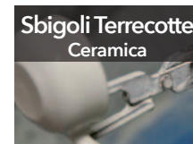
Sbigoli Terrecotte Ceramica