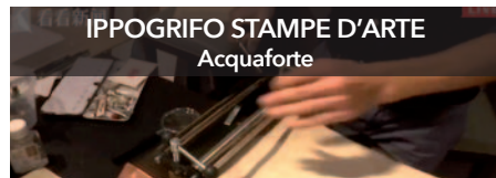
IPPOGRIFO STAMPE D'ARTE Acquafornte